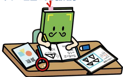
【読書】キャラクター「おっほん」