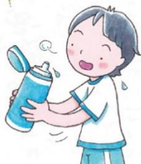
こまめに水分補給