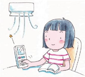
冷房の温度を下げ過ぎない