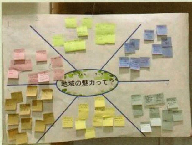
テーブルA 地域の魅力ってなに？