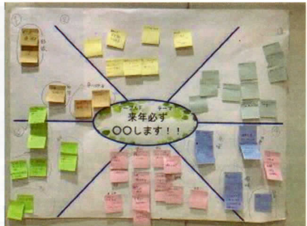
テーブルF 来年必ず〇〇します！