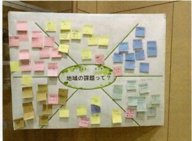
テーブルB 地域の課題ってなに？