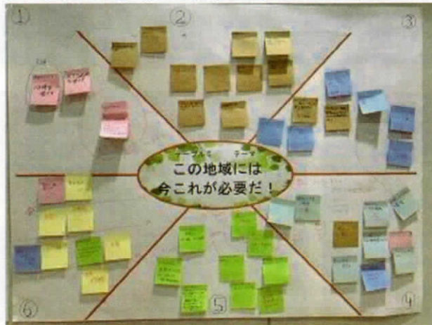
テーブルC 地域には今これが必要だ！