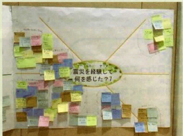
テーブルD 震災について感じたことは？