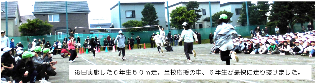
後日実施した6年生50m走。全校応援の中、6年生が豪快に走り抜けました。

今年も運動会に関しまして、保護者の皆様の数々の御支援、本当にありがとうございました。天気の影響を大きく受ける中での実施となりましたが、学校からのアナウンスによく耳を傾けて行動いただき、先生方に気遣いの言葉を掛けてくださる方々もいて、大変ありがたく思っています。天気には恵まれませんでした。子どもたちは「全緑!」でそれぞれの競技に臨むことができました。どうもありがとうございました。