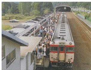
紅葉狩り臨時列車(JR石勝線滝ノ上駅) 1994(平成6)年 小樽市総合博物館蔵蔵コレクション