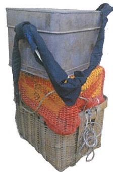
行商人が使ったガンガン(再現) 小樽中央市場同組合蔵