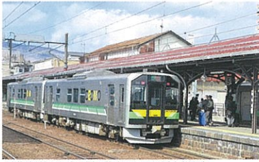
JR北海道の電気式気動車H100形(小樽駅)