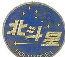
環状口特急北斗星のヘッドマーク 北海道鉄道技術館蔵