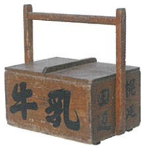
駅立売容器(幌延駅前の田辺商店) 昭和期 幌延町郷土資料館蔵