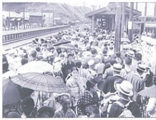
海水浴客でにぎわう銭函駅のホーム 1937(昭和12)年