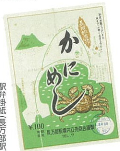
駅弁掛紙(長万部駅) 1960年代頃