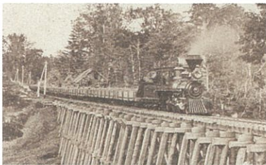
機関車弁慶号 1883(明治16)年頃