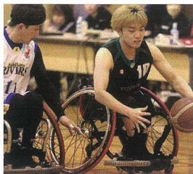
車いすバスケット