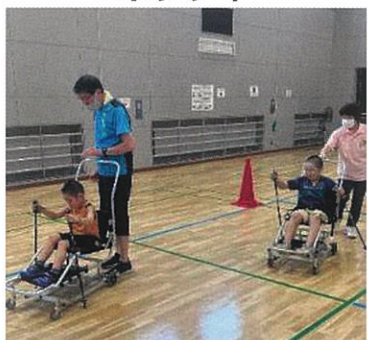
ローラーシットスキー