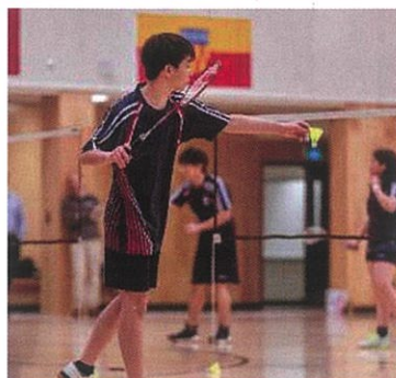
デフバドミントン