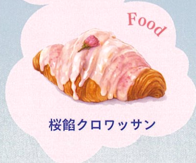
桜餡クロワッサン

With fins, everything will be possible. 2026. 3. 25 (水) Wed