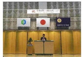
育成会成人式の様子