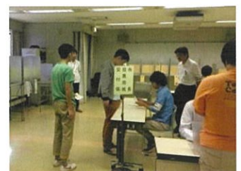
選挙模擬投票体験