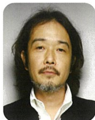
リリー・フランキー イラストレーター 作家・俳優など