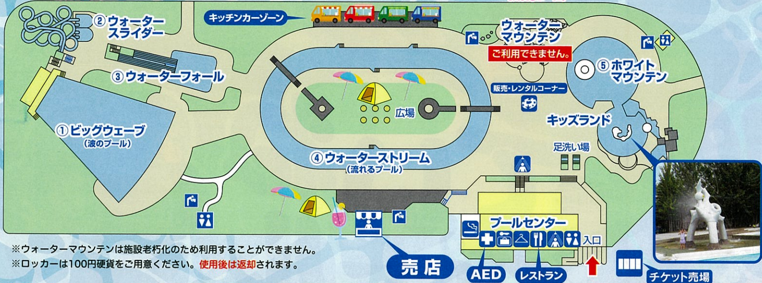
⑤ホワイトマウンテン

※ウォーターマウンテンは施設老朽化のため利用することができません。 ※ロッカーは100円硬貨をご用意ください。使用後は返却されます。