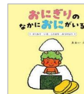
「おにぎりのなかにおにがいる」