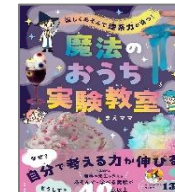
「魔法のおうち実験教室」