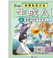
「未来を広げる生成AI」