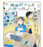
「図書だよりとひみつのノート」