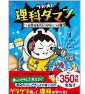
「つかめ!理科ダマン」