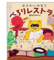
「ようかいのもり べろりレストラン」