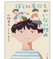
「ぼくに友だちがいない理由」