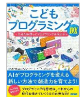
「こどもプログラミングDX」