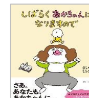
「しばらくあかちゃんになりますので」