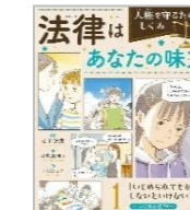
「法律はあなたの味方 人権を守るためのしくみ」