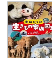
「命はぐくむ生きもの家族図鑑」