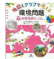
「地図とグラフで考える環境問題」