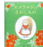
「エメラルドのさがしもの」