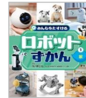
「みんなをたすけるロボットずかん」