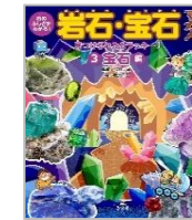
「石のふしぎがわかる!岩石・宝石ずかん」