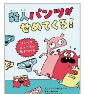
「殺人パンツがせめてくる!」