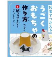
「授業でつかえるうごくおもちゃの作り方」