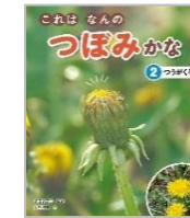
「これはなんのつぼみかな」