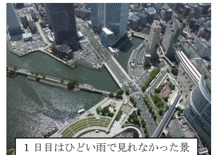
1日目はひどい雨で見れなかった景色も、2・3日目には快晴となり、最高の眺めを堪能できました。