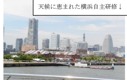
天候に恵まれた横浜自主研修↓