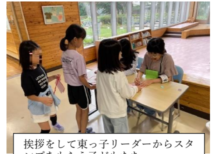
挨拶をして東っ子リーダーからスタンプをもらう子どもたち

さて、明日から夏季休業日です。今年度は30日間の長い休みとなります。お子様が有意義な夏休みを送るためには、子ども自らが考えて実行し、自分の考えたことを最後まで行うことが大切です。次の声掛け、どちらが子どもの力を引き出せるでしょうか。