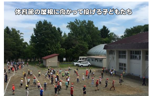
体育館の屋根に向かって投げる子どもたち

さて、本校では、中休みの最初の5分間をマッスルタイムという名称で縄跳び運動を中心に体力づくりに取り組んでいます。6月のマッスルタイムは「なげなげタイム」というサブ名称で、体育館の屋根を目標に力強くボールを投げたり、投げる角度や腕のふりを意識しながら体育館で投てきロケット(ロケット型の投げる学習用具)を投げたりするなど、投げる技能を高めることに特化した時間を設定しました。ボールを遠くに投げるためには、体重移動や腰の回転、肩の回転や腕の振り、手首のスナップなど体のいろいろな動きを組み合わせることが大切になっていきます。ボールを体育館の屋根に何とか届かせようと必死になったり、投てきロケットを遠くに飛ばそうと投げ方を工夫したり・・・子どもたちはゲーム感覚で楽しみながら、投げる運動に浸ることができました。