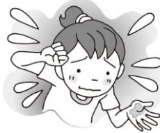
汗をかきすぎる。 または、全くかかない。