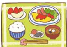
朝、昼、夜の食事を食べる。