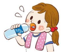
こまめに水分をとる。