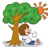
すずしいところで、時々、休けいをとる。