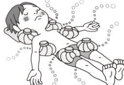
首・わきの下・足の付け根を冷やす。