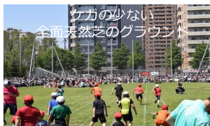
ケガの少ない 全面天然芝のグラウンド