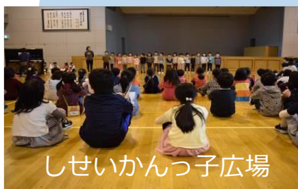
しせいかんっ子広場