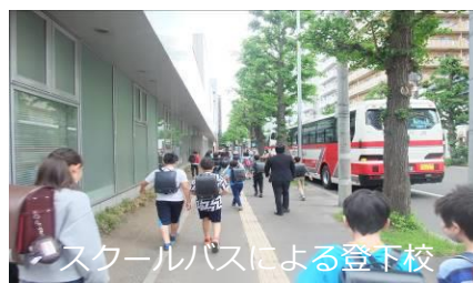
スクールバスによる登下校