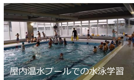
屋内温水プールでの水泳学習