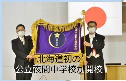
北海道初の 公立夜間中学校が開校