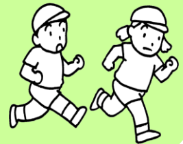
体をつなぐ子ども