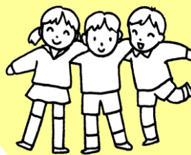
心をつなぐ子ども