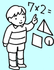
学びをつなぐ子ども