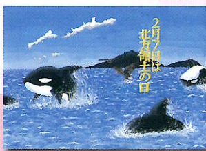
2022年度 最優秀賞 (中学生)