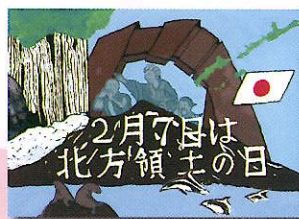
2022年度 優秀賞 (中学生)