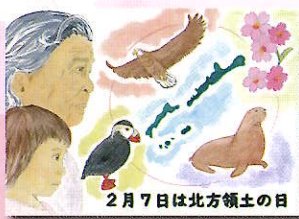
2022年度 優秀賞 (小学生)