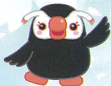
北方領土のイメージキャラクター えとびりかの「エリカちゃん」