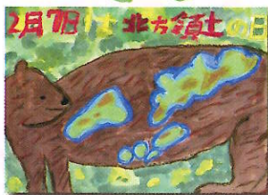
2022年度 最優秀賞 (小学生)