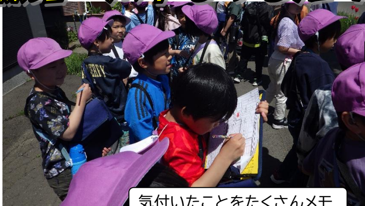
気付いたことをたくさんメモ