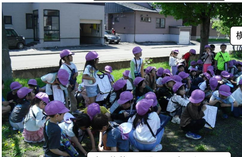
少し休憩～。頑張って歩いたね!