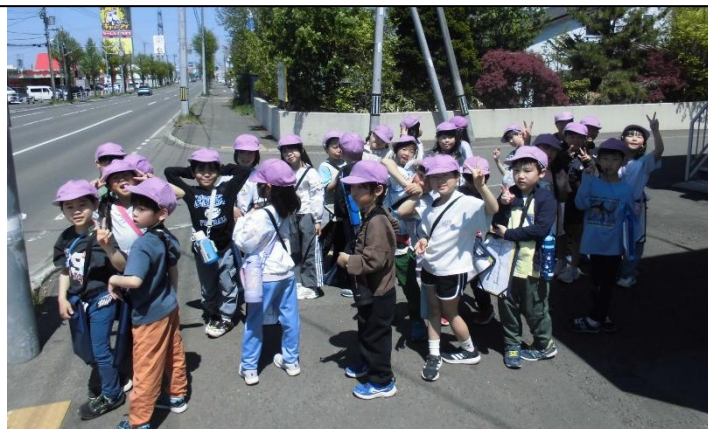
横断歩道では、すばやく4列になって安全に渡りました!