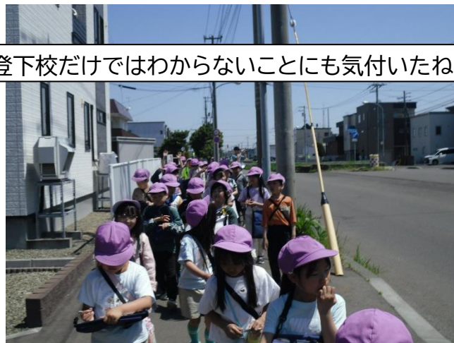
登下校だけではわからないことにも気付いたね