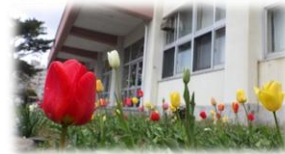
玄関前に咲くチューリップに心が癒されます。

https://www.taiheiminami-e.sapporo-c.ed.jp/