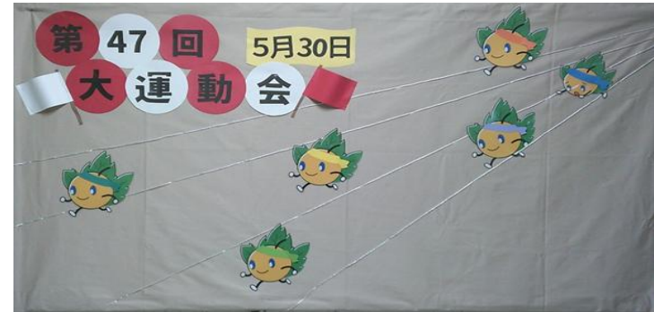
PTA 室前の掲示板の装飾

日時 令和8年 5月30日（土）8時50分～ （延期の場合：5月31日（日）その後は順延）