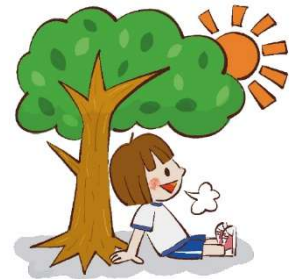
ときどき木陰などで休む