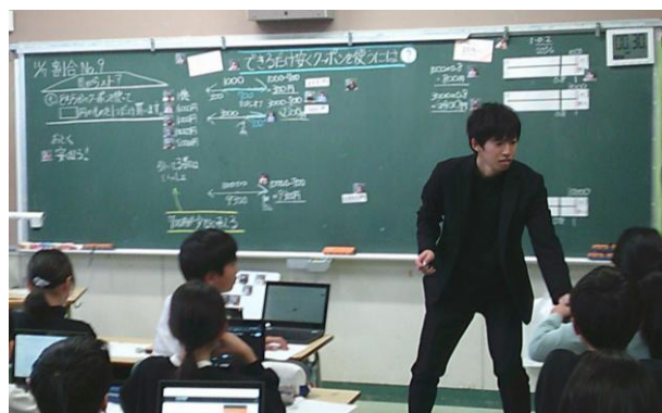
【5年2組 教育実践発表会授業写真】

今年度は、子どもたちが学び合いの中で見付けた“本時の価値＝カギ”を基に、「数値を変えたら…」、「もしもこうだったら…」と、さらに学びを進めていく姿をねらった授業に努めてきました。5年生の「割合」の授業では、買い物をすると、700円引きクーポンと20%引きクーポンのどちらを使うと安く買えるのかを考える授業を行いました。「うわ、700円引きはお得じゃないよ。」「〇〇円の時、20%引きがお得だ。」と発表したり、友達の考えを聞いて、「なるほどね。と