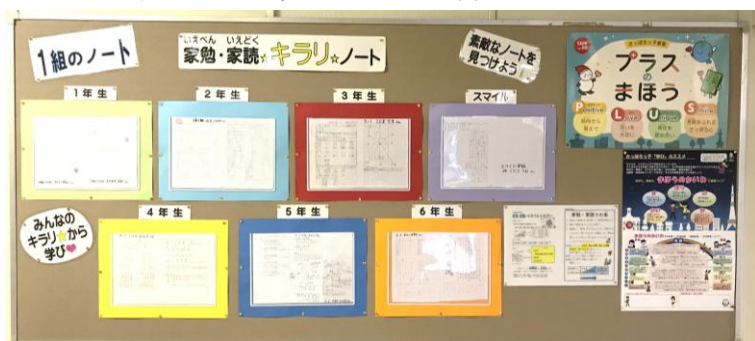
【1階玄関前 家勉ノート専用掲示板】

さらに、東園小学校で重点をおいて取り組んでいる家勉でも、たくさん素敵な姿が見られました。授業で学んだ内容を基に、授業以上に複雑な面積の問題を自分で考えて図に表しながら面積を求めたり、その日の学習を自分なりにまとめ直したり、数値を変えて類題に取り組んだりする子どももいました。これまでは学校から定められた宿題で家庭学習に取り組んでいた子どもたちが、授業での学びを自分で捉え直して、次の学びへと動き出せるようになっています。