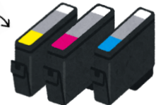
※インクカートリッジは純正品のみが対象となります。

ちなみに、キャノン、ブラザー、エプソンの使用済み インクカートリッジ 、トナーカートリッジも実はベルマーク点数となります。職員室前に専用の回収箱がありますので、使用済みのカートリッジはぜひ学校へお持ちください。