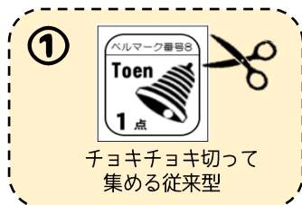
① チョキチョキ切って集める従来型