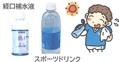
スポーツドリンク