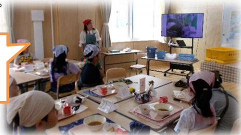
昨年のランチルーム給食の様子

6月～7月にランチルーム給食を行います。ランチルーム給食は、教室とは違う環境で楽しく食事をすると同時に、感謝の心や協力して社会性を養う態度、食の知識を深める機会とします。