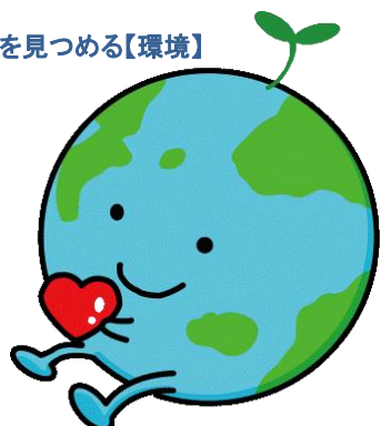
【環境】キャラクター「ちっきゅん」