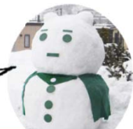
「ゆきだるまん」雪像 ※西区土木部制作