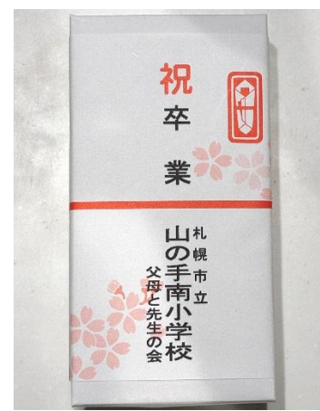
卒業のお祝いとして、祝果の紅白餅