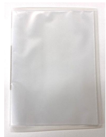
通知表をご自宅で保管 する際の通知表綴じ