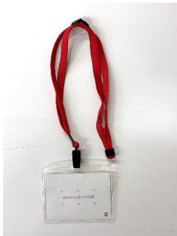
来校する際に着用する ネームカードフォルダ